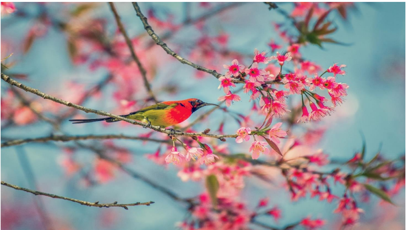
Alle fuglegrupper i Jægerhuset synger med eget næb og bibringer til en farvestrålende oplevelse.