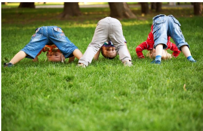
Sammen er vi modige.

Vi er ude det meste af dagen og har i øjeblikket kun mindre grupper indenfor i aktiviteter. Der er fokus på at styrke finmotorik via kreative aktiviteter eller lege indenfor. Der arbejdes med at bevæge kroppen, stå på et ben, hoppe, kravle, sidde stille under en faldskærm, yoga hos de ældste børnehavebørn, bevægelser på motorikbanerne i alle aldre i Jægerhuset. Udenfor er der muligheder for at klatre i træer og udforske sanserne ved at gynge eller gå på bare tæer. Vi er i gang med planerne om at opbygge en sansehavne med dufte og smags oplevelser, herunder lavendler, roser, figen-fersken og æbletræer. På ture ud af huset, har vi fokus på kropslige udfoldelser af forskellige art- gå på line, klatre højt, rutsje ned af en bakke, kravle under en træstamme og gå langt i skoven.