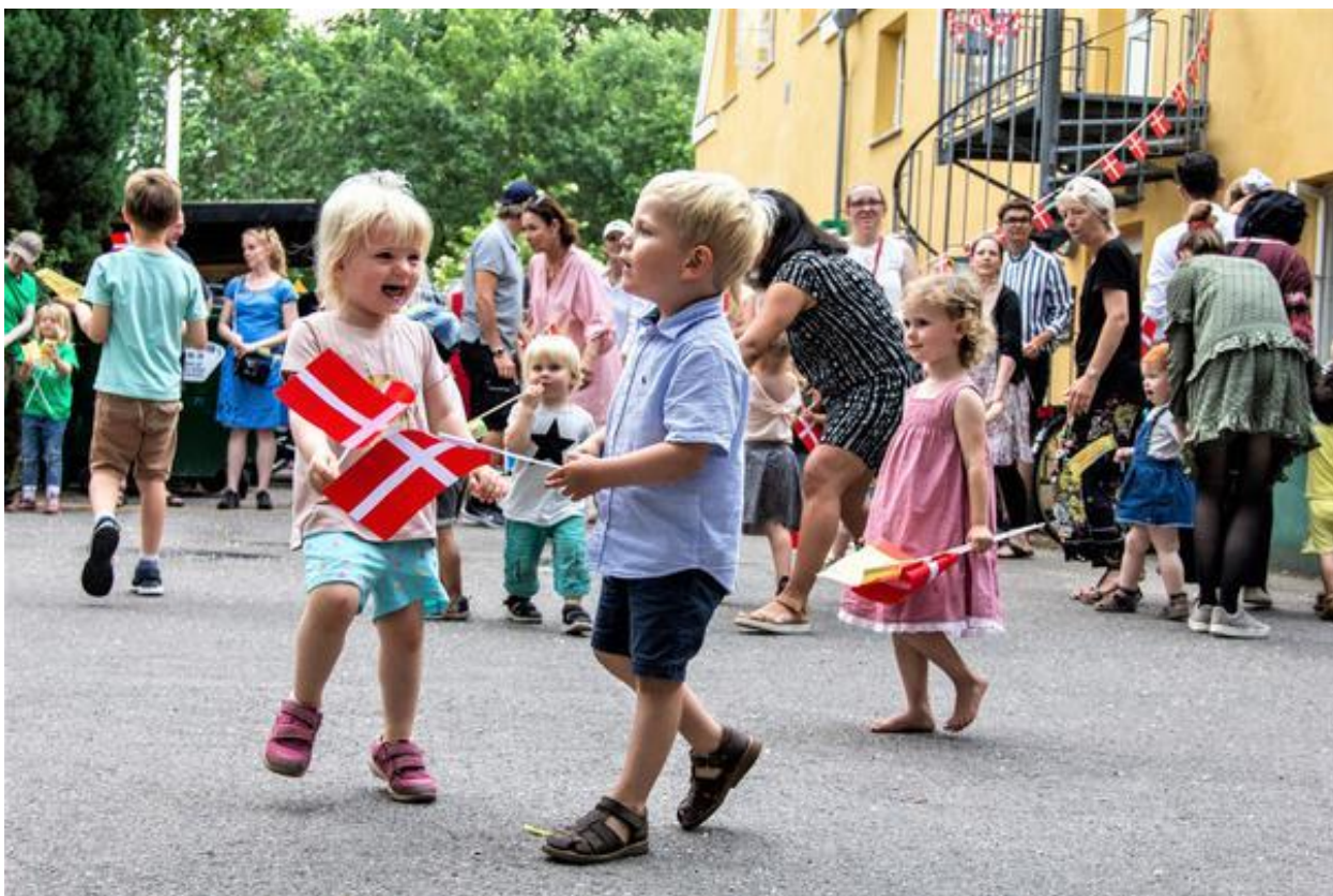
Jægerhusets runde fødselsdag.

I Jægerhuset arbejder vi ud fra at det fysiske, psykiske og æstetiske børnemiljø, skabes af den gensidige påvirkning som finder sted mellem både børnene, det pædagogiske personale og omgivelserne. At der er en rød tråd gennem hele huset i dagligdagen, i traditionerne og udsmykningen af huset. At der er en pædagogisk diskussion om på hvilken måde vi tilgår den kreative udsmykning hos de forskellige grupper, ud fra alder og udvikling. At vi stiller os undrende og har modet til at spørge hinanden: på hvilken måde understøtter vores indretning børns muligheder for leg og læring, har vi indrettet ude og inde bedste muligt i forhold til sundhedsfremmende udvikling på det motoriske plan, har vi nok kunst i børnehøjde, på hvilken måde prioritere vi f.eks. de stille aktiviteter osv. Vi reparerer der hvor det er muligt, indkøber nyt når ting ikke kan laves, at børnene får lov til at bestemme maling på taburetter og lignende og selv maler.